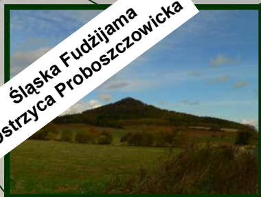
Śląska Fudżijama Ostrzyca Proboszczowicka