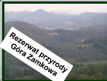
Rezerwat przyrody Góra Zamkowa