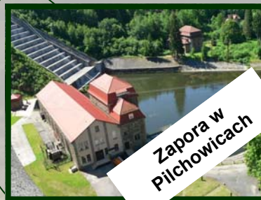
Zapora w Pilchowicach