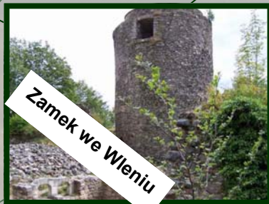
Zamek we Wleniu